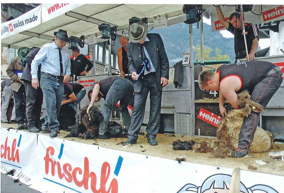
Dicht drängten sich auf der Schafschurbühne die Akteure (hier die Junioren) und die Richter