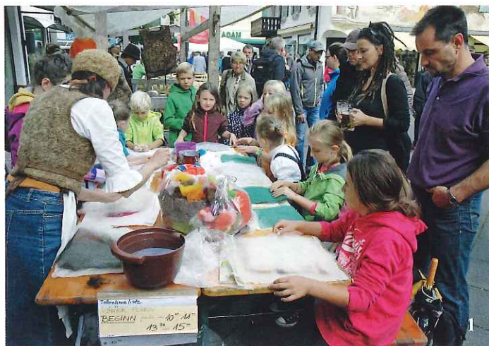
1: Die Kleinen konnten sich beim Filzen beschäftigen.